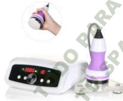
CAVITADOR UNOSETION 40K. Mod. EsKa 852