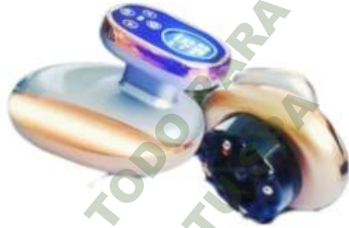
VACUUM, ELECTROESTIMULACION Y RF PORTABLE. Mod. EsKa 926