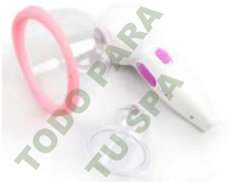
VACUUM PORTATIL. Mod. EsKa 925