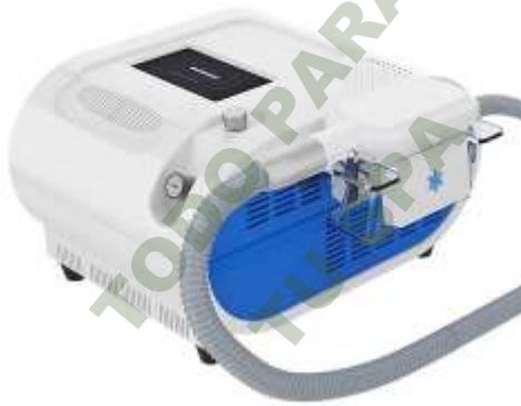
CRIOLIPOLISIS UN MANIPULO -10°C.