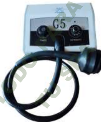
MAQUINA DE MASAJE VIBRATORIA G5.