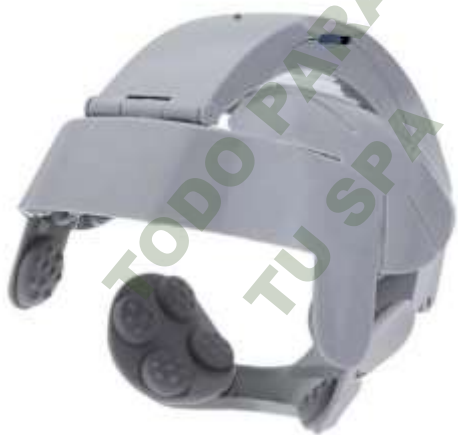
RELAX TOTAL. Mod. EsKa 1053