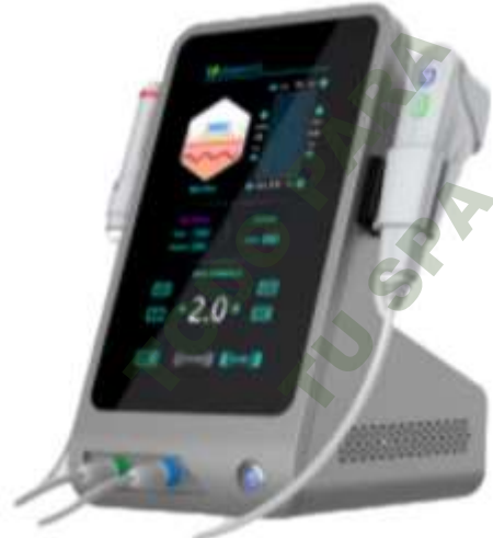
HIFU 2 EN 1. Mod. EsKa 1147