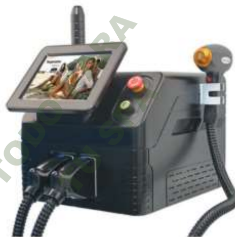
LASER PICOSEGUNDO Y LASER DIODO 808 2 EN 1.