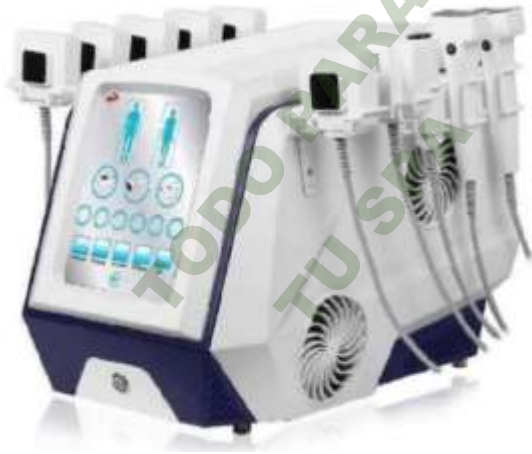
RF. MONOPOLAR. Mod. EsKa 1146