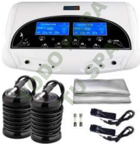
DESINTOXICADOR IONICO DUAL CON CINTURON TERMICO.