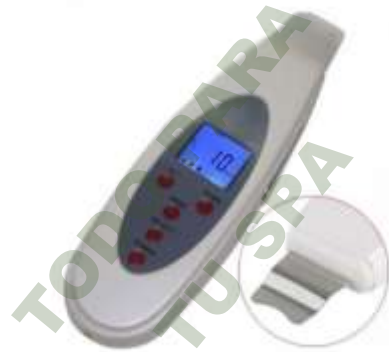
SKIN SCRUBBER 4-1 (PEELING, TONE, CLEAN, LIFTING).