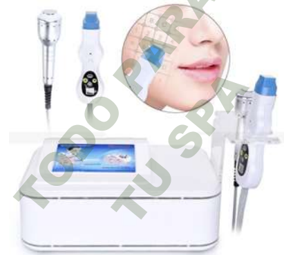
RADIOFRECUENCIA FRACCIONADA MATRIZ DE PUNTOS Y CRYOTERAPIA. Mod. EsKa 830

Facebook- https://www.facebook.com/share/JBgJn9AxJJBEbUR/?mibextid=qi2Omg