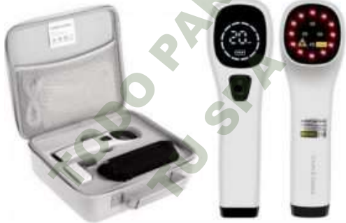
LUZ ROJA NIR PORTATIL.