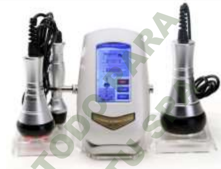
CAVITADOR 40K CON RADIOFRECUENCIA FACIAL Y CORPORAL. Mod. EsKa 854

Facebook- https://www.facebook.com/share/JBgJn9AxJBEBUR/?mibextid=qi2Omg