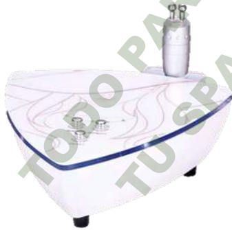
BIO-LIFTING. Mod. EsKa 827