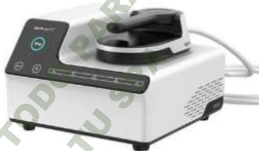
HI-EMT CON RADIOFRECUENCIA 1 APLICADOR.