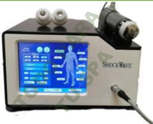
ONDAS DE SHOCK.