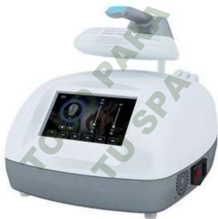
HI-EMT 1 APLICADOR.