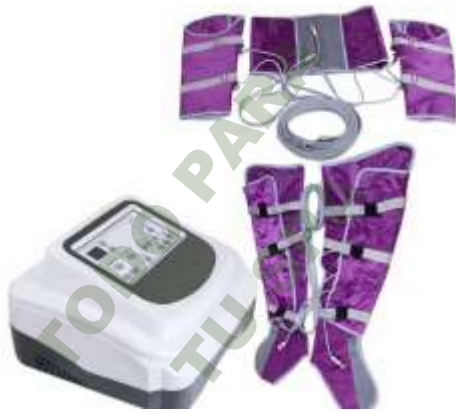
PRESOTERAPIA PROFESIONAL. Mod. EsKa 937