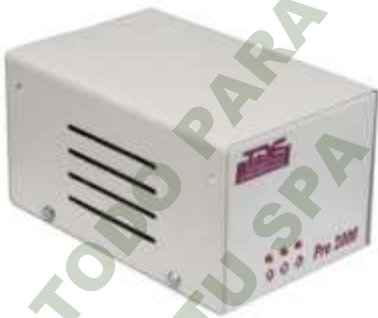
REGULADOR DE VOLTAJE 2000W.