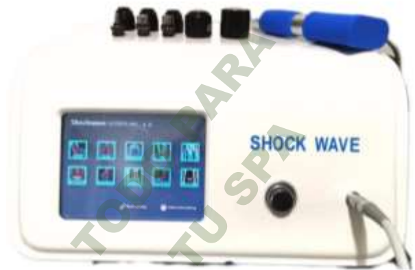
ONDAS DE SHOCK WAVE SISTEMA INTELIGENTE.