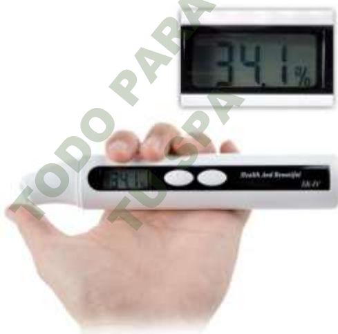
ANALIZADOR DE HUMEDAD. Mod. EsKa 1116