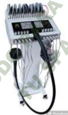
MAQUINA DE MASAJE VIBRATORIA G5 Y ELECTROESTIMULACION CON BASE.