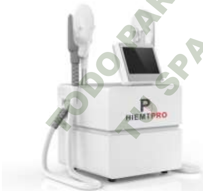
EMS-CULPT PRO. Mod. EsKa 1074