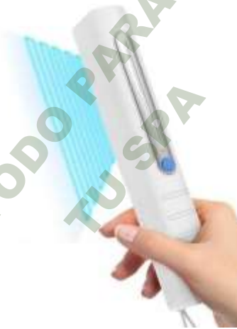
SANITIZANTE UV DESINFECTANTE 99%. Mod. EsKa 1114