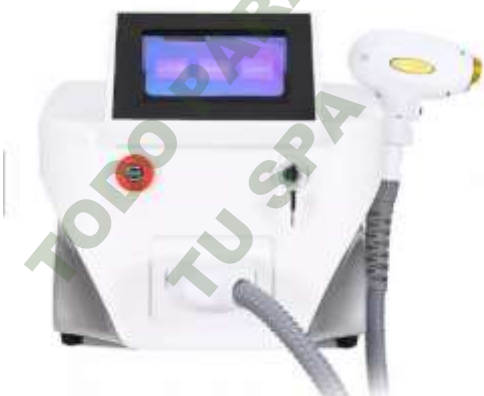
DIODO LASER MAX TRI.