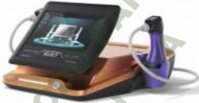
HIFU 2 MANIPULOS EMS Y RF.