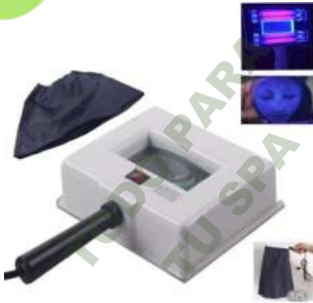
LAMPARA WOOD. Mod. EsKa 985