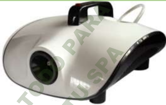
ESTERILIZADOR DE HUMO.