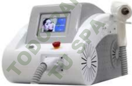
ND YAG Q-SWICH.