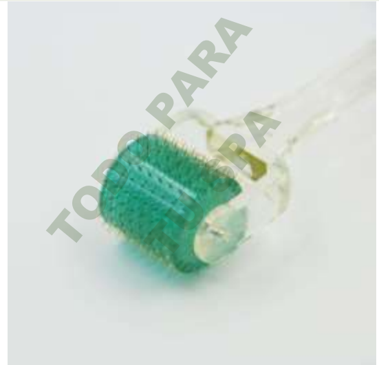
DERMAROLLER DE 192 PUNTAS PARA PIEL SENSIBLE CON MEDIDAS DE 0.5, 1.0, 1.5, 2.0MM.