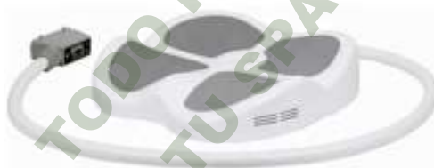
ASIENTO PELVICO HIFEM, ACCESORIO PARA HIFEM- 4 Y HIFEM-2.