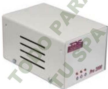
REGULADOR DE VOLTAJE 800W.