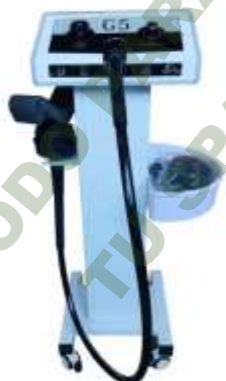
MAQUINA DE MASAJE VIBRATORIA G5