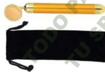
MASAJEADOR DE JADE.