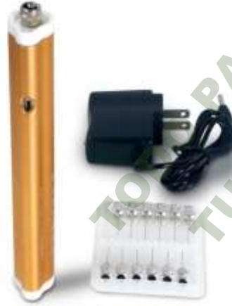
PLASMA PEN. Mod. EsKa 1098