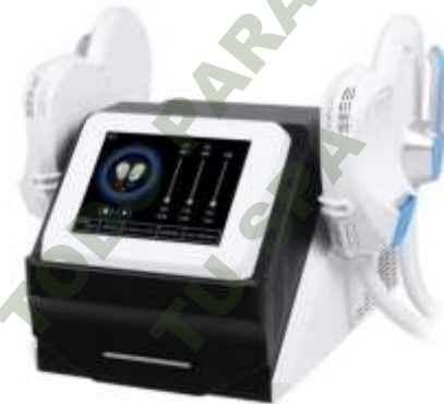
EJERCITADOR MUSCULAR DE ALTO RENDIMIENTO CON TRATAMIENTO EN OBESIDAD 1. Mod. EsKa 1077

Facebook- https://www.facebook.com/share/JBgJn9AxJJBEbUR/?mibextid=qi2Omg