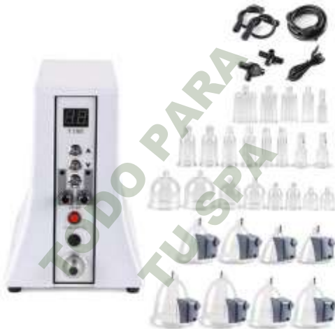
VACUUM COPAS DELFIN. Mod. EsKa 927