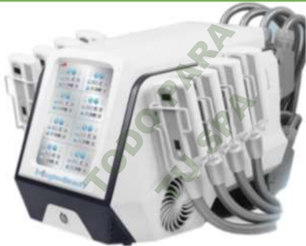
CRYOLIPOLISIS COLD. Mod. EsKa 1148