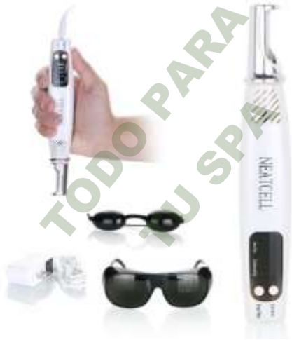
PLUMA LASER PICOSURE.