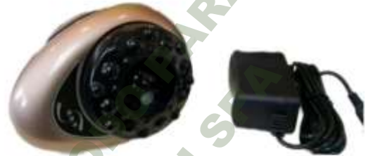
VACUUM PORTATIL CORPORAL CON RF. Mod. EsKa 928

Facebook- https://www.facebook.com/share/JBgJn9AxJJBEbUR/?mibextid=qi2Omg