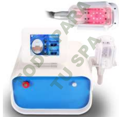
EQUIPO DE CRIOLIPOLISIS.