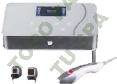
RADIOFRECUENCIA FRACCIONADA. Mod. EsKa 829