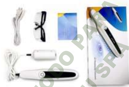
FOTOTERAPIA. Mod. EsKa 986