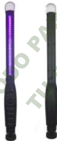
ESTERILIZADOR UV 99%.