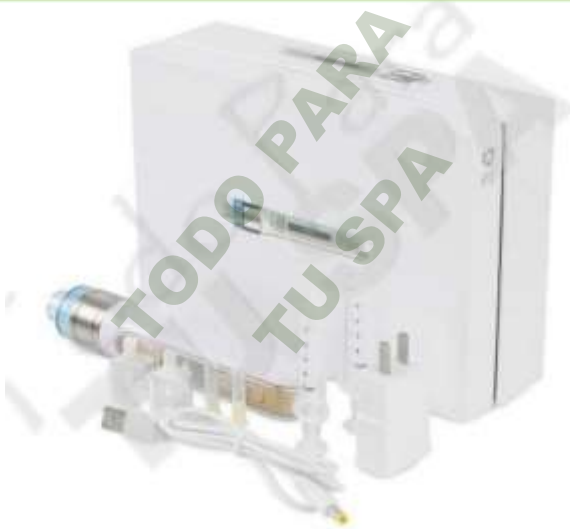
PLUMA PARA MESOTERAPIA INYECTADA.