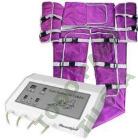
PRESOTERAPIA PROFESIONAL PLUS. Mod. EsKa 938