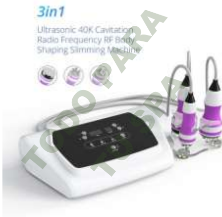
3 EN 1 CAVITACION 40K RADIOFRECUENCIA CORPORAL Y FACIAL. Mod. EsKa 853