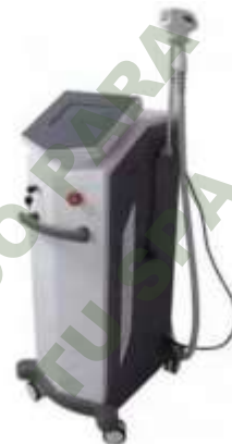
LASER DIODO PARA DEPILACION SUPER 808.