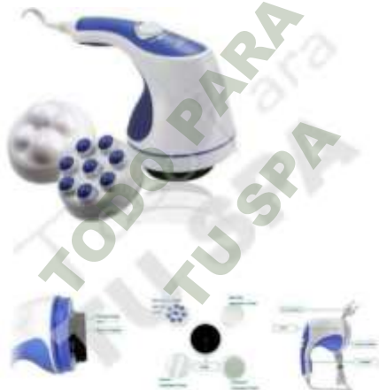
MASAJEADOR RELAX. Mod. EsKa 1056

Facebook- https://www.facebook.com/share/JBgJn9AxJJBEbUR/?mibextid=qi2Omg