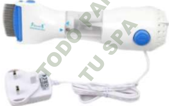
ASPIRADORA PARA PIOJOS.