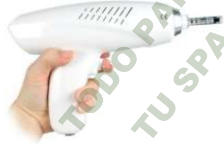
MESOTERAPIA SIN AGUJA NEBULIZADOR.