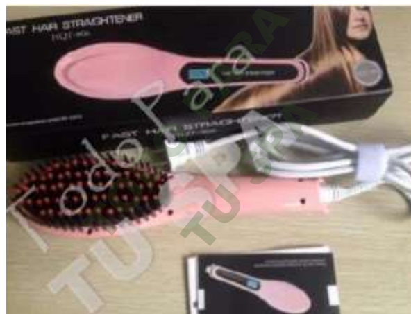
PLANCHA/CEPILLO IONICO PARA ALACIADO DE CABELLO.