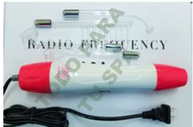
ALTA FRECUENCIA CON 4 ELECTRODOS.