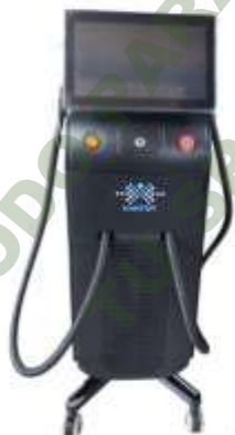
LASER QUATRIDIODO 2 MANIPULOS 3D 808.