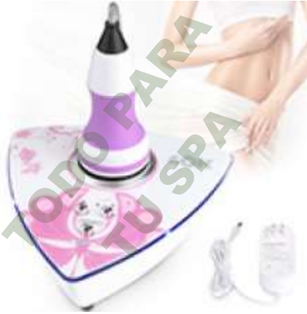
CAVITADOR PORTATIL 40K. Mod EsKa 851