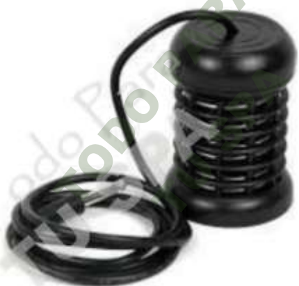
REPUESTOS DESINTOXICADOR IONICO (ARRAY). Mod. EsKa 1055