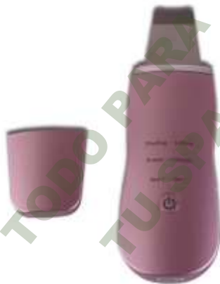
SKIN SCRUBBER PORTATIL INALAMBRICO CON GALVANICA +/-