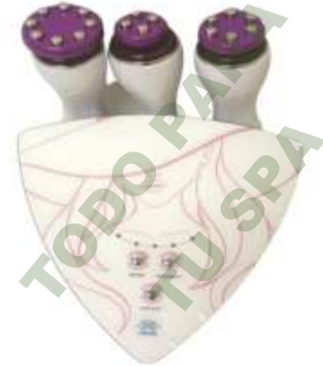
RADIOFRECUENCIA GIRATORIA DE 360 GRADOS. Mod. EsKa 828