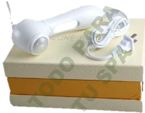
GENERADOR DE OZONO PORTATIL.