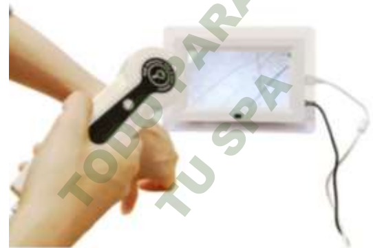
ANALIZADOR PROFESIONAL DE PIEL. Mod. EsKa 1117

Facebook- https://www.facebook.com/share/JBgJn9AxJBEBUR/?mibextid=qi2Omg