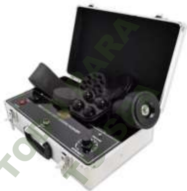
MAQUINA DE MASAJE 5 EN 1 G5 CABEZAS DE MASAJE.