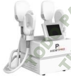
EMS-CULP PRO CUATRO PLACAS. Mod. EsKa 1075