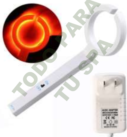
BUSCADOR DE VENAS PROFESIONAL.