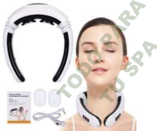
MASAJEADOR DE CUELLO. Mod. EsKa 1054