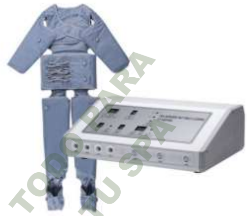
PRESOTERAPIA PROFESIONAL PLUS CON SISTEMA TERMICO. Mod. EsKa 940

Facebook- https://www.facebook.com/share/JBgJn9AxJJBEBUR/?mibextid=qi2Omg