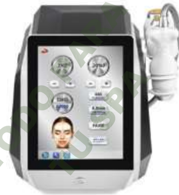
HIFU 4D ICE.