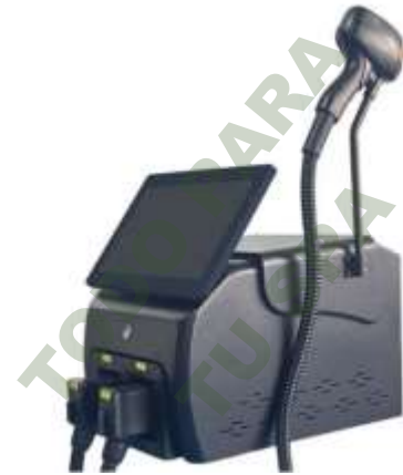
SOPRANO + PICO LASER. Mod. EsKa 1149

Facebook- https://www.facebook.com/share/JBgJn9AxJJBEbUR/?mibextid=qi2Omg