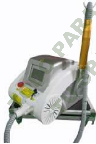
PICOLASER PICOSEGUNDO Q SWITCH LASER YAG.