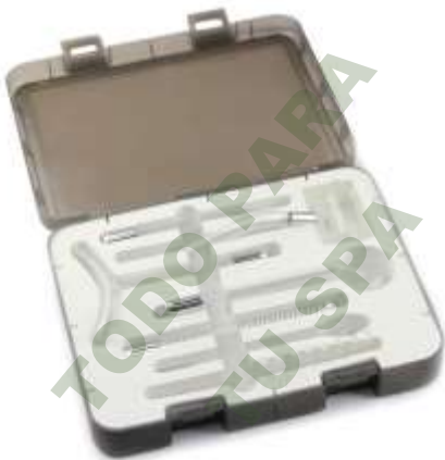
KIT DE ELECTRODOS PARA ALTA FRECUENCIA.