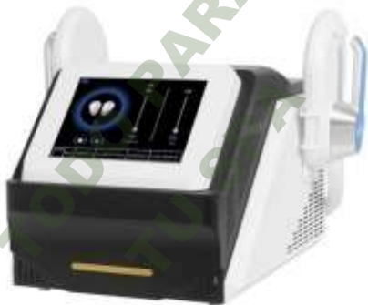
HIEM EJERCITADOR MUSCULAR PROFESIONAL. Mod. EsKa 1076