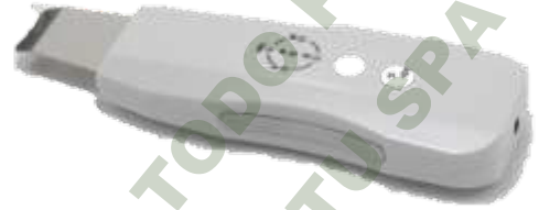
SKIN SCRUBBER PORTATIL INALAMBRICO.