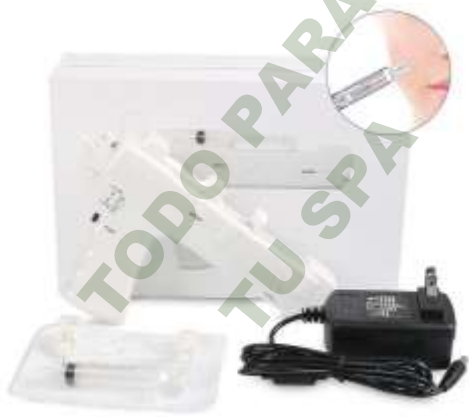
PISTOLA PARA MESOTERAPIA.