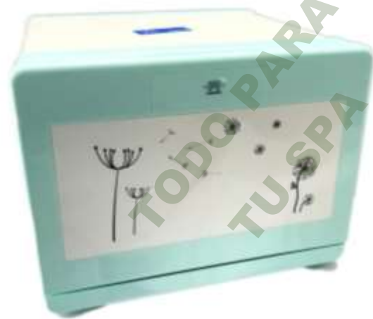
ESTERILIZADOR DE OZONO. Mod. EsKa 1115