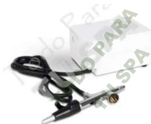
AEROGRAFO PARA MAQUILLAJE.