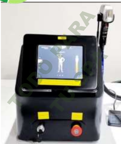
LASER DIODO SOPRANO TITANIUM.