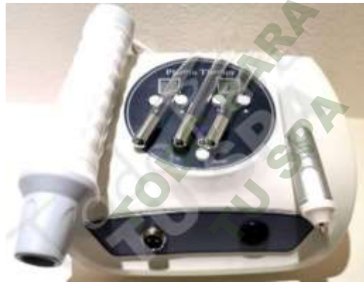
PLASMA-PEN NUEVA GENERACION. Mod. EsKa 1100