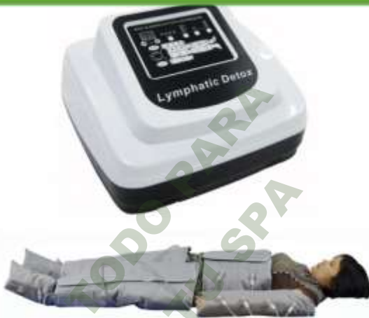
PRESOTERAPIA PROFESIONAL CON SISTEMA TERMICO. Mod. EsKa 939