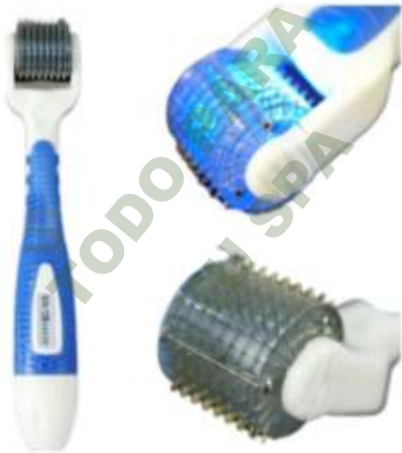
DERMAROLLER DE 1MM CON CROMOTERAPIA EN PAQUETE DE 4 PIEZAS (ROJO, AZUL, VERDE, AMARILLO).